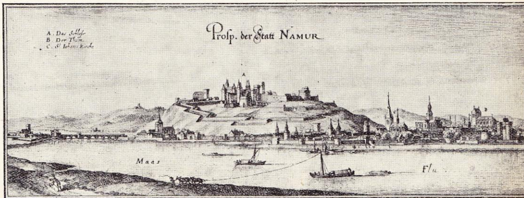
Vue de Namur au XVIII e siècle.

de la Sambre et de la Meuse. Grâce à ces mêmes routes naturelles, l'endroit devint vite un marché facilement approvisionné et aisément fréquenté. Comme d'ailleurs toutes les villes dont la situation commande de belles voies de communication, Namur fut ainsi, dès son origine, place de guerre et marché régional. Et ce double caractère, qui